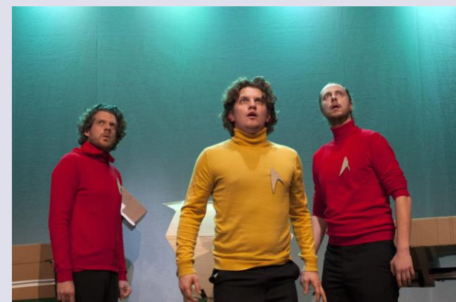
Bron: Illustere Figuren